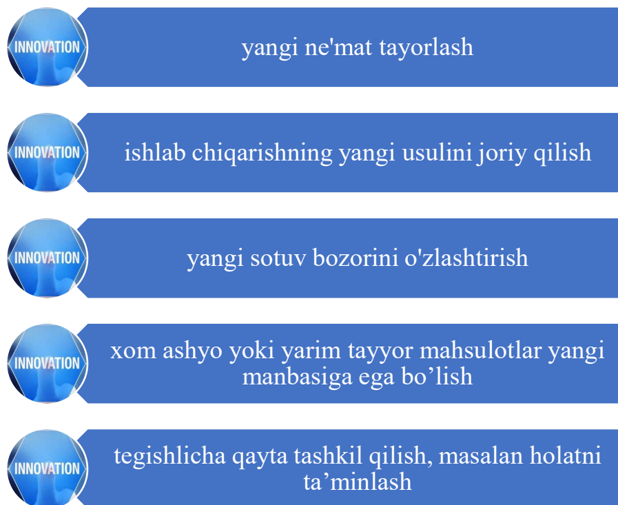
1-rasm. Korxonaning innovation faoliyat turlari 9

yoki quroli deb qaradi. Uning qarashlarida innovatsiya sifatida quyidagi besh hol nazarda tutilganligini ko‘rish mumkin 8 (1-rasm):