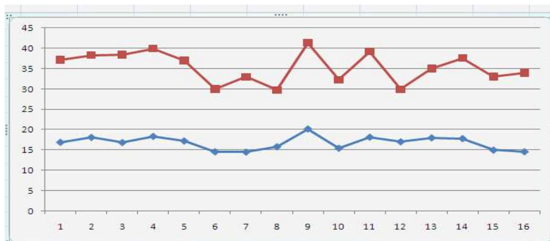
1.-rasm. Davlat va fuqarolarning interaktiv xzmatlarini baholash mezonlari.

AKTning ta‘siri kam bo‘lib, uning rivojlanishi faqat muayyan darajaga yetganidan keyingina yalpi ichki mahsulotning jon boshiga o‘shisini ta‘minlash mumkinligi qayd etilgan. Respublikamiz iqtisodiy sektoriga AKTga jalb etilgan investitsiyalar hajmi oxirgi yillar mobaynida tahlil qilingan davlat boshqaruvi organlari va korxonalar bo‘yicha sof foyda miqdori ortganligi fikrimiz isboti bo‘la oladi.