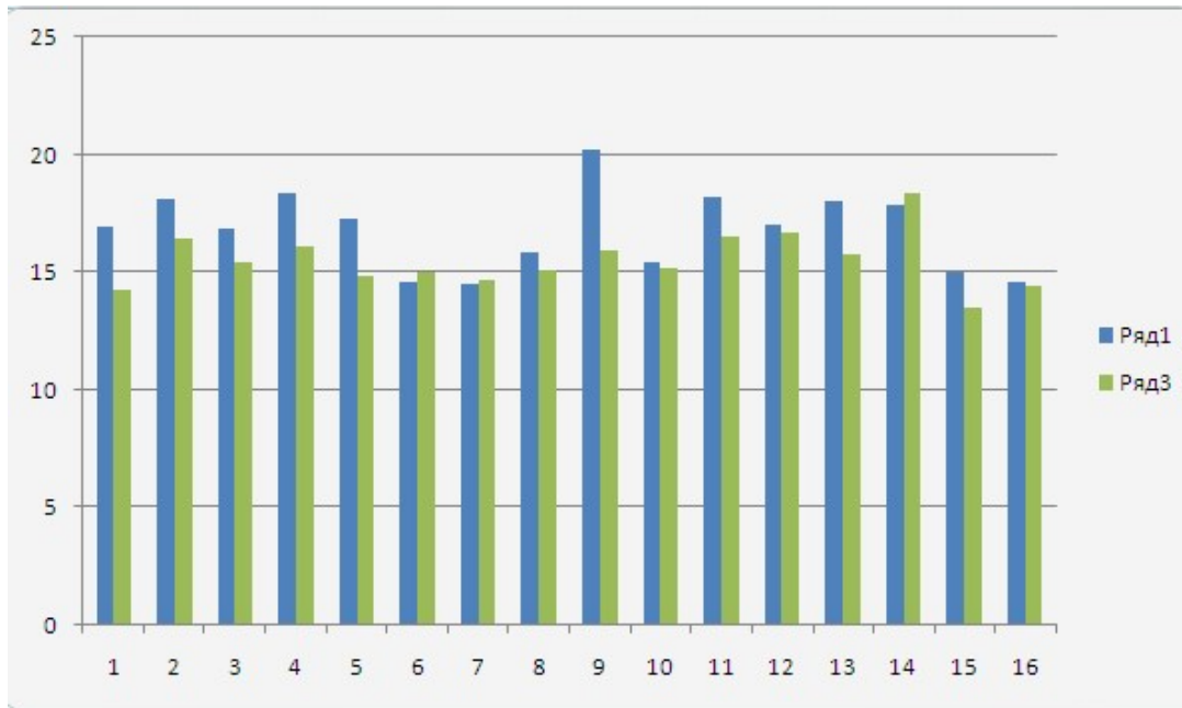
2.-rasm. Davlat va fuqarolarning interaktiv xzmatlarini baholash mezonlari[1-4].

Xulosa o‘rnida aytib o‘tmoq joiz, biz qanchalik e‘tiborli bo‘lsak, interaktiv xizmatlardan to‘laqonli foydalansak, ularning afzalliklari va kamchiliklarini aniq va ravon yoritib bera olsak, davlat tashkilotlarining ish faoliyatini rivojlantirish va ularni baholash imkoniyatiga ega bo‘lamiz.