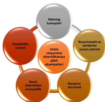
1-rasm. Diversifikatsiyalashning foydasi 96

Ammo bazi bir yirik korxonalar diversifikatsiyadan ko‘zlagan maqsadlari faqatgina foyda olish emas balki bozordagi o‘rinlarini yanada kengaytirish, o‘z nomlari ostida ishlab chiqarilgan maxsulotni brend darajasiga olib chiqish hamda riskni maxsulot turlariga taqsimlashdir.